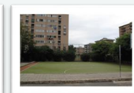
Campo di erba sintetica